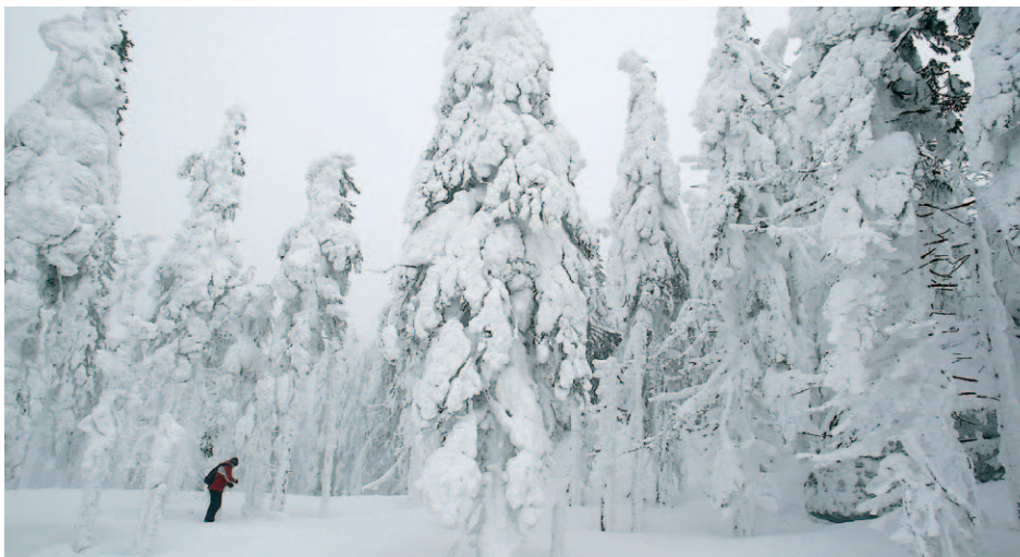
Zde se uplatní scénický režim „zima“